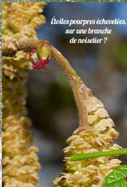
Étoiles pourpres échevelées, sur une branche de noisetier ?

Ils soignent leur houppe, les bourgeons-fleurs du noisetier.